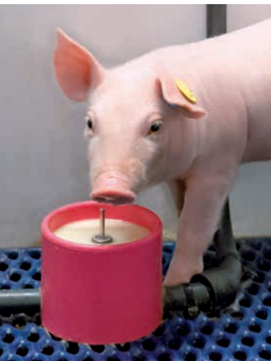
In RescueCups wird Milch und flüssiger Prestarter angeboten.